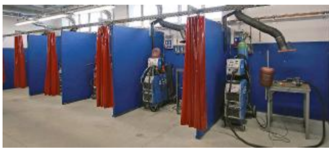
Le nuove postazioni per la saldatura

no alla saldatura. E proprio la saldatura è l'ambito per il quale l'ampliamento del reparto porterà i cambiamenti più significativi: nei nuovi spazi sono state infatti installate 10 ulteriori postazioni per la saldatura, con apparecchiature di ultima generazione, che saranno utilizzate dagli studenti per i laboratori durante l'orario didattico, ma non solo.