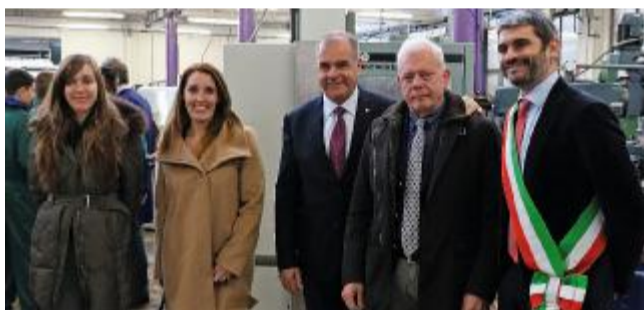
Foto di gruppo per le autorità presenti all'inaugurazione

Forte di queste nuove dotazioni, infatti, l'Istituto San Gaetano amplia la propria attività di corsi rivolti alla riqualificazione dei lavoratori inoccupati e diventa da oggi il punto di riferimento nella provincia di Vicenza per il rilascio di tutti i patentini richiesti agli operatori della saldatura. Questo grazie all'accordo tecnico-commerciale sottoscritto proprio ieri con l'Istituto Italiano