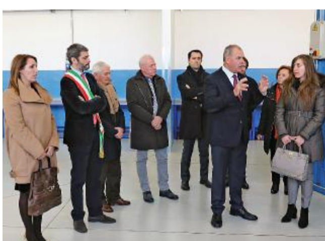
Un altro momento dell'inaugurazione

Questo senza nulla togliere, naturalmente, alla formazione per la riparazione dei veicoli tradizionali: così, le dotazioni si sono arricchite anche di un nuovo carro ponte da 50 quintali, che